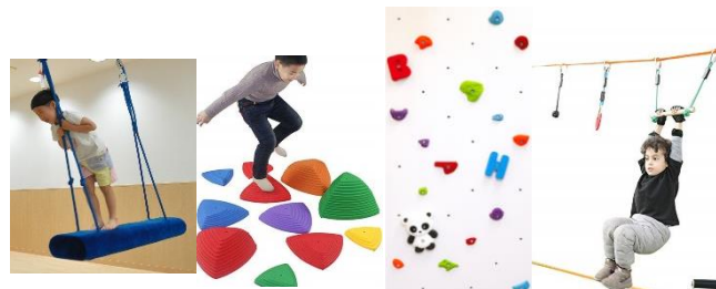
★個別療育 ●小集団療育

療育設備：写真はイメージ ボルダリング・スラックライン・感覚統合吊り具・バランスストーン 跳び箱・鉄棒・ヨガハンモック・e-タッチゲーム・バランスボール