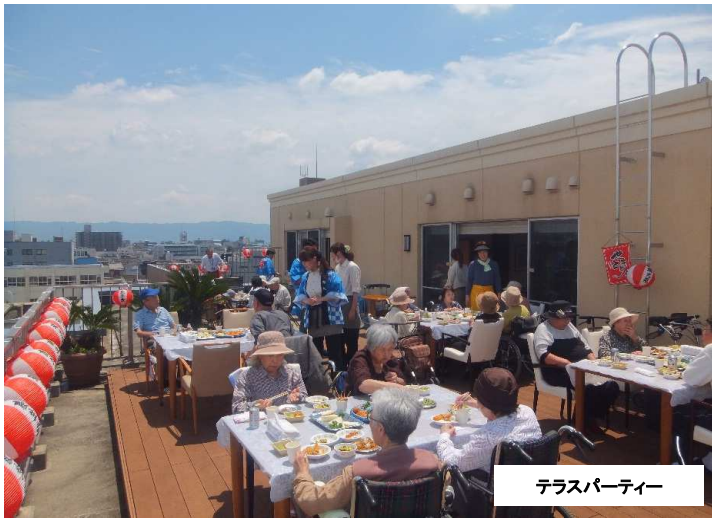
テラスパーティー